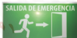
506 SALIDA con luz recargable