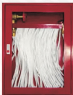
304 Gabinete sobreponer 82 x 67 x 15