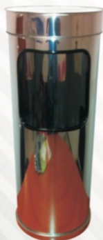
312 Porta extintor