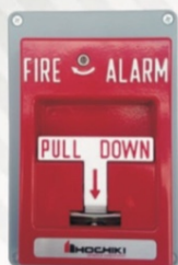
501 Botón de paro