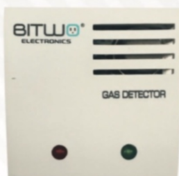
516 Detector de gas