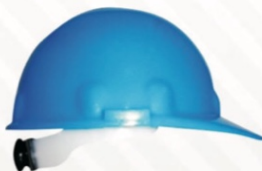
720 Casco con matraca