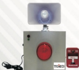
511 Alarma con fuente de poder