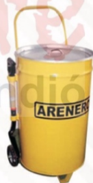
716 Bote arenero