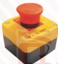
504 Botón paro de emergencia