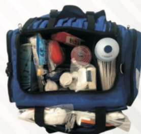
319 Botiquín de mochila profesional