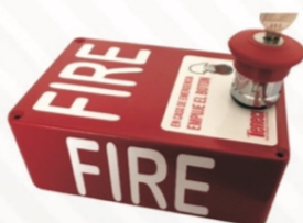
512 Estación manual con batería incluida y sirena 112 db 15 W