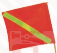
707 Banderin de PVC