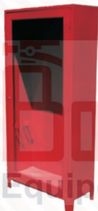
308 Para 2 Equipos de bomberos 180 x 70 x 40