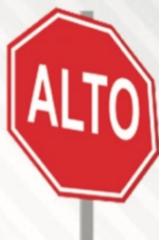
706 Letrero hexagonal