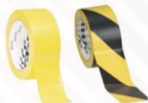
Cinta para marcar pisos