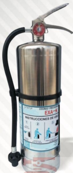
224 Químico K