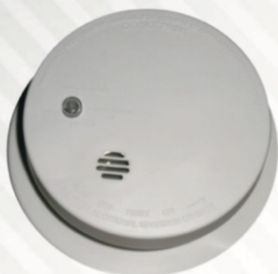
515 Detector de Humo