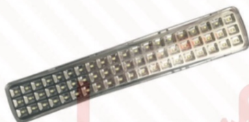
505 Lámpara de emergencia 60 Leds de 130 V. dura 25 hrs.