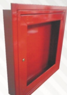
305 Gabinete empotrar 82 x 67 x 15