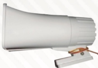
502 Sirena de 2 tonos 120 dc