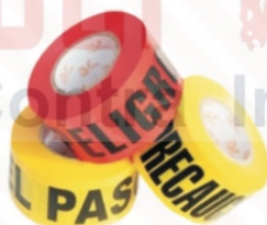
713 Cinta: Peligro