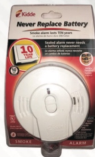
517 Detector de Humo 10 años garantía