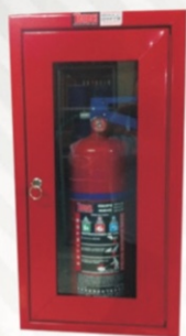
302 p/extintor 75 x 40 x 25