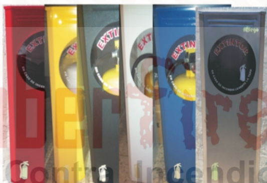
314 Porta extintor cuadrado en 5 colores: Rojo, amarillo, negro, blanco, azul y plata