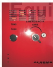
507 Fuente de poder con botón de emergencia