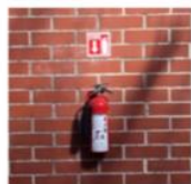
VENTA DE EQUIPO CONTRA INCENDIO