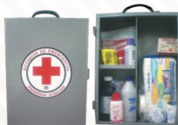
316 Botiquín con medicamentos