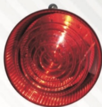
503 Estrobo rojo de 75 destellos por min.