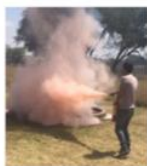
RECARGA Y MANTENIMIENTO DE EXTINTOR